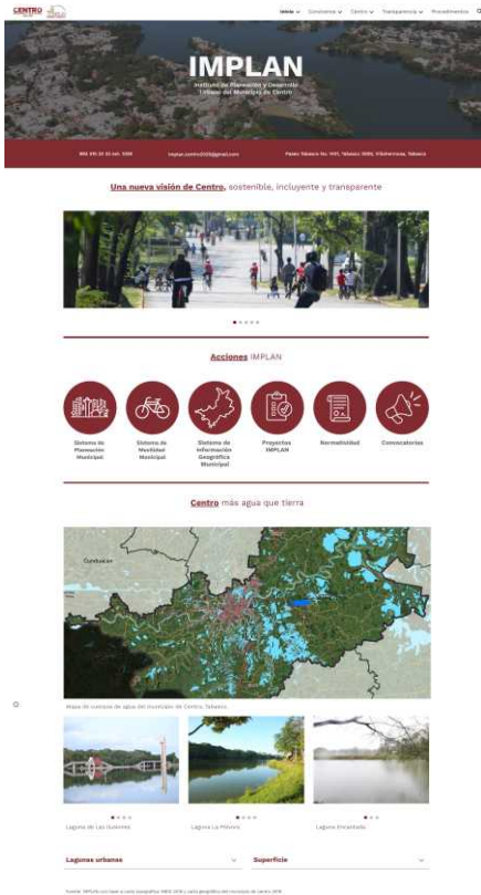
Portada Página Web IMPLAN

Informar a la ciudadanía de la normativa existente para la ubicación de asentamientos humanos, zonas de riesgo, programas de ordenamiento territorial, desarrollo urbano y el uso de suelo en el territorio.