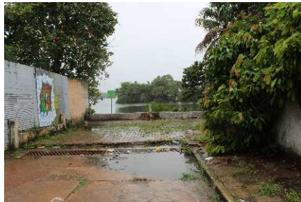
Laguna de las Ilusiones, Zona Norte