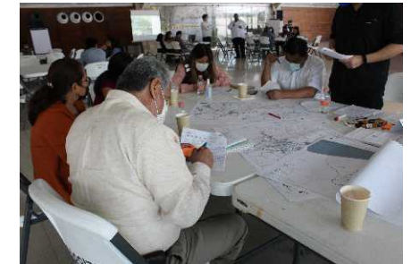
Taller de Participación Ciudadana