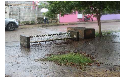
Vaso Regulador San José, Gaviotas Sur