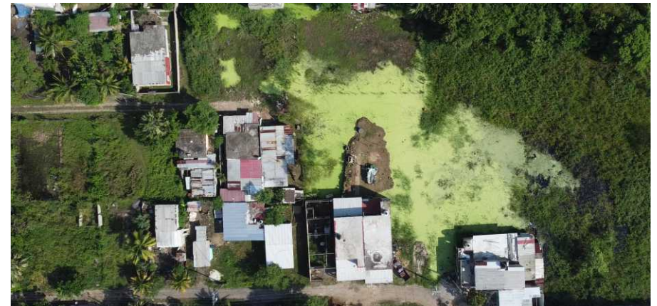
Gaviotas Sur, Sector Armenia, Fuente: Programa de Ordenamiento Territorial de la Región Sur-Sureste