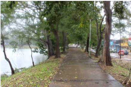
Laguna Encantada, Gaviotas Norte.