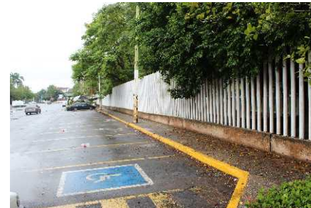
Parque La Pólvora, colonia Reforma.